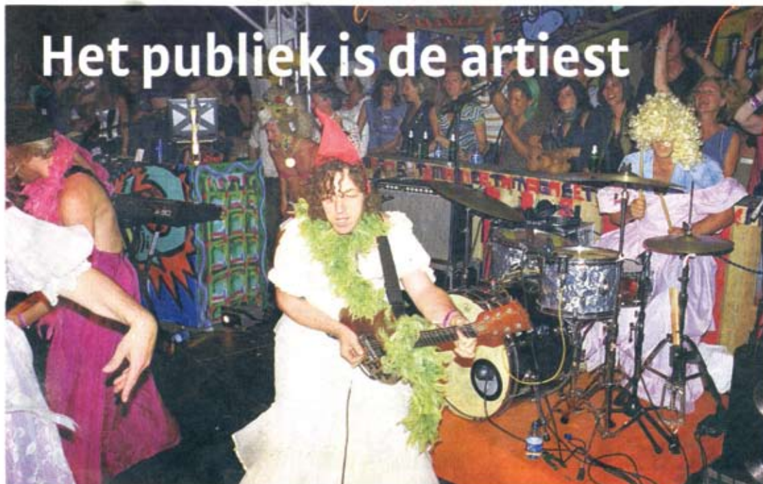
Claw Boys Claw in de Magneetbar op Lowlands, 2008.

Steuw van officiële zijde is er evengevoel wel steun voor het festival: de avond in Trouw wordt gesubsidieerd door het Amsterdams Fonds voor de Kunst en het internetplatform, dat zondag online gaat, ontvangt geld van de stichting Digitale Pioniers.